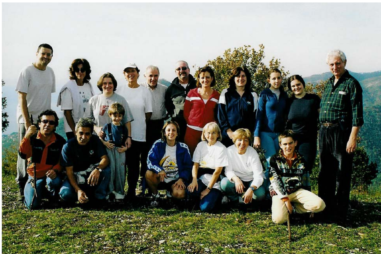
Presso la chiesa dell'Ascensione e la statua del Redentore, tra Sori e Camogli (9 novembre)