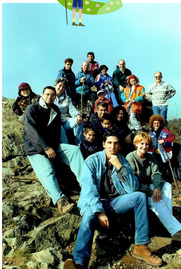
Alla scoperta dell'Adelasia - SV (22 ottobre)