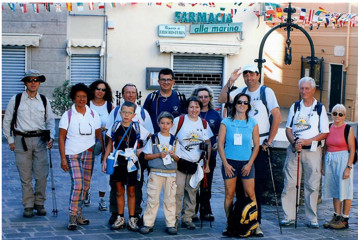
Manifestazione della Maremonti ad Arenzano (10 settembre)