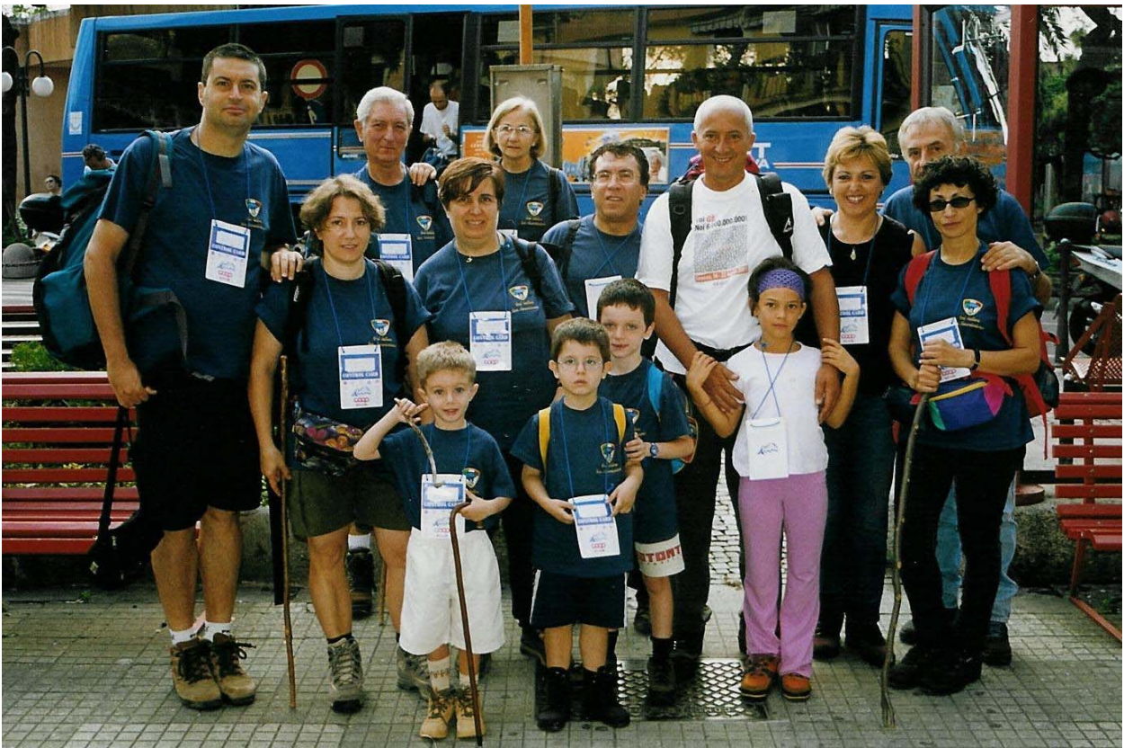
Partenza alla manifestazione Maremonti ad Arenzano (8 settembre)