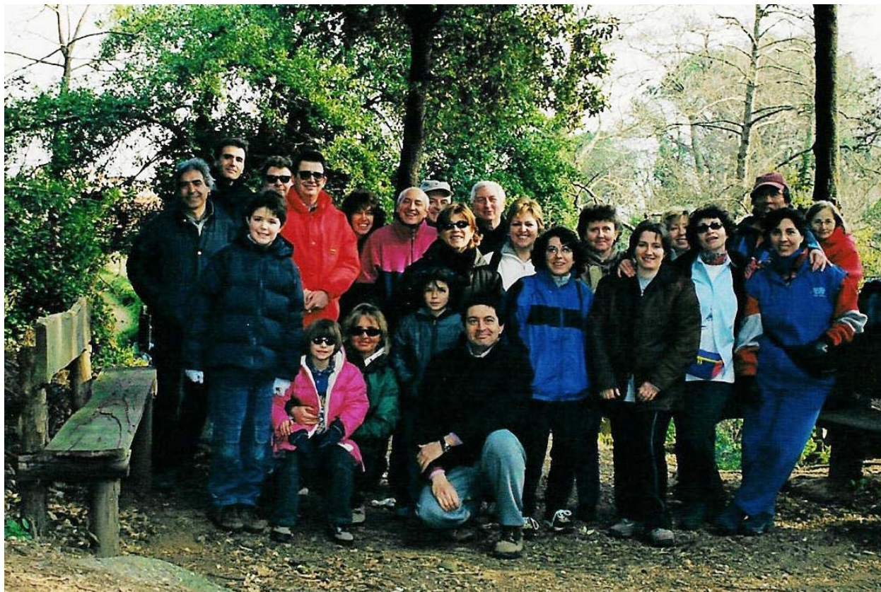
Dal mulino Gassetta (allora in rovina, ora ristrutturato), sul monte di Portofino (9 febbraio)