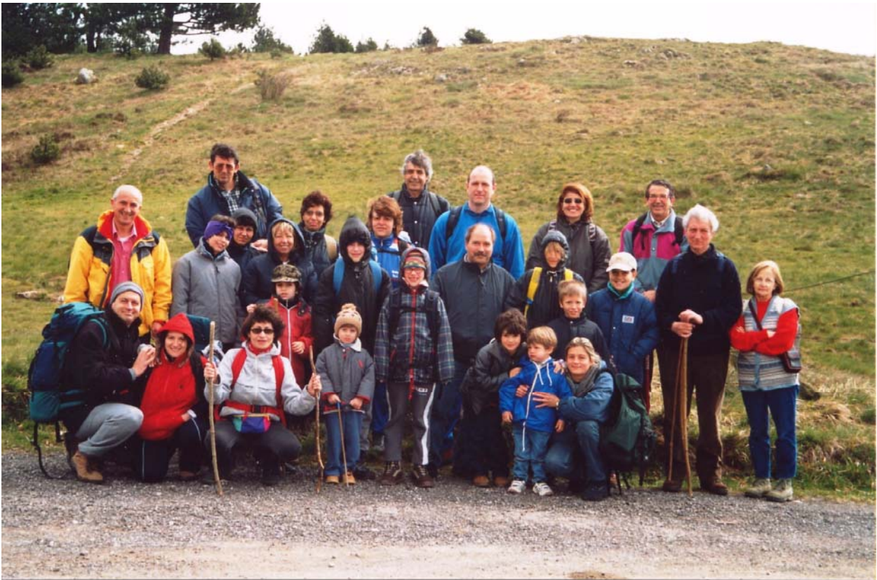
Inizio del giro per i laghi del Gorzente, tra Liguria e Piemonte (21 aprile)