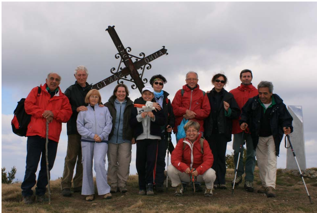
La cima del monte Gottero - SP (28 settembre)