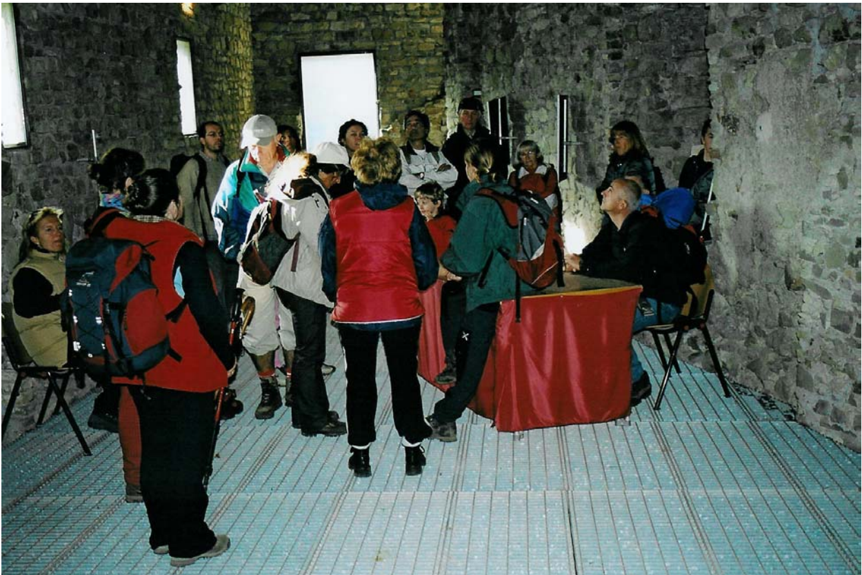
Visita al Castello della Pietra, non lontano da Vobbia (7 novembre)