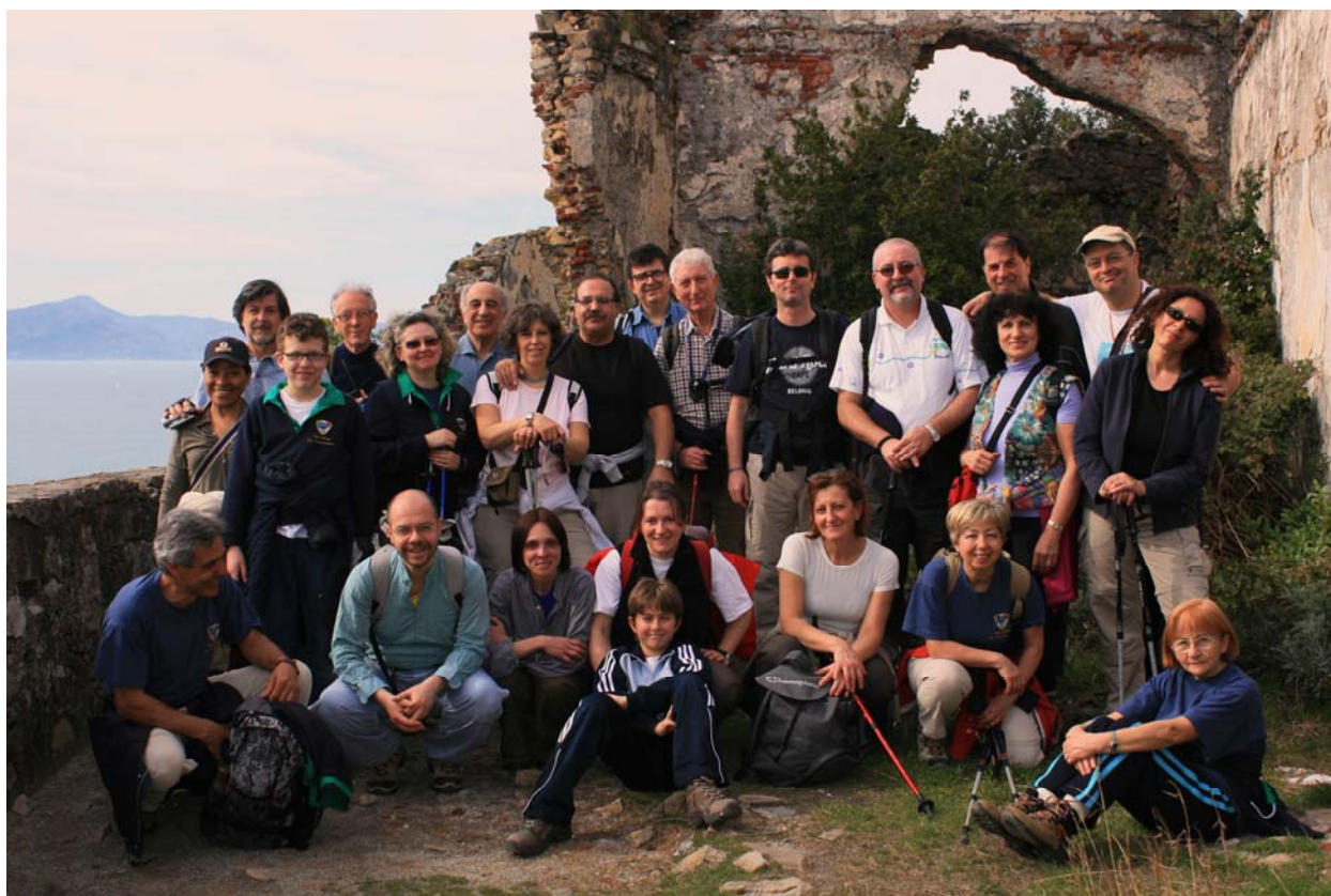
Ruderi della chiesa di Sant'Anna, nei pressi di Sestri Levante (8 marzo)