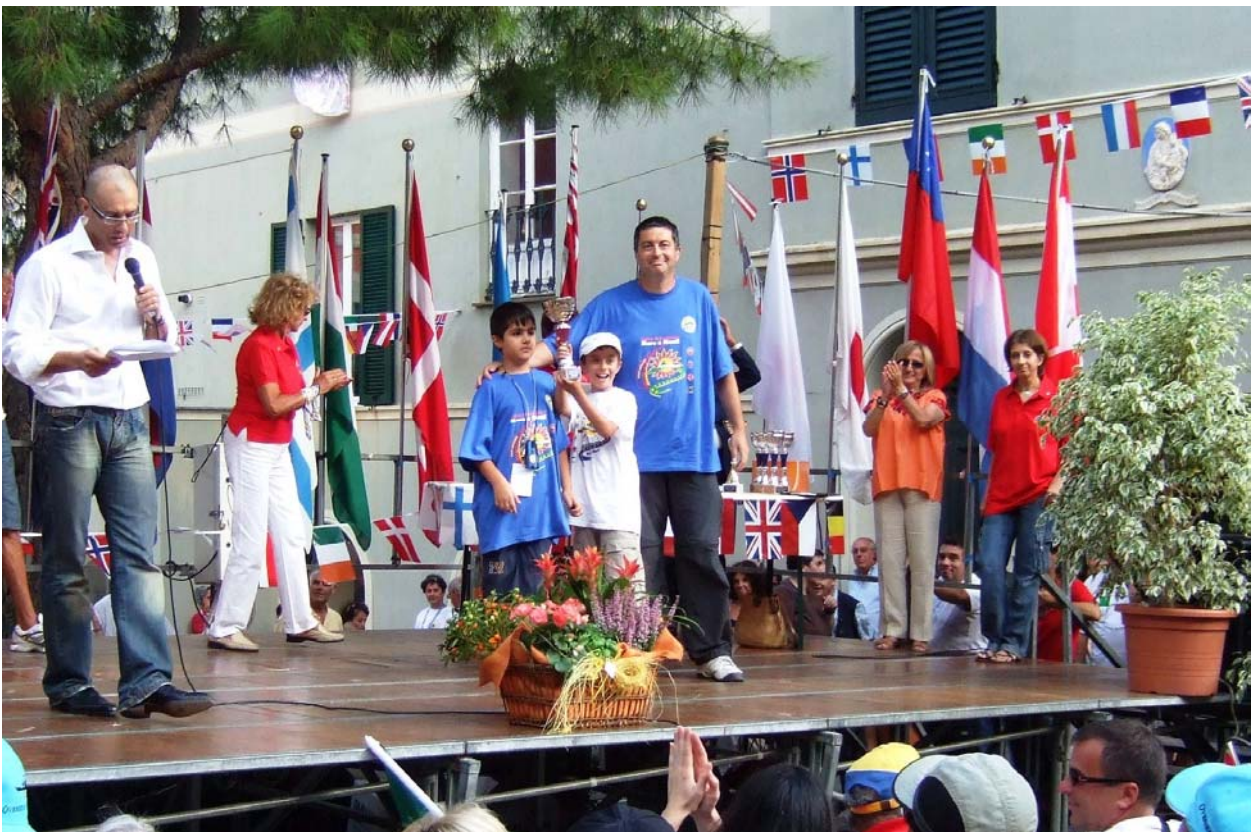
Premiazione della manifestazioni Maremonti ad Arenzano (9 settembre)