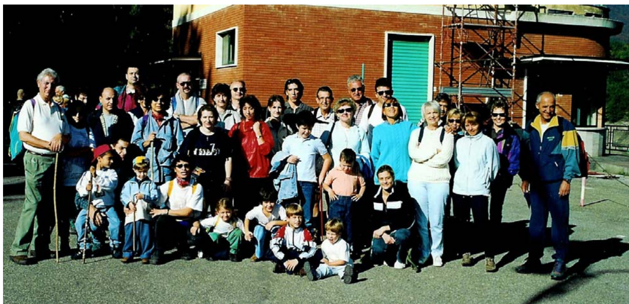
L'acqua dei genovesi: il lago Brugneto (14 ottobre)

Il presente numero è scaricabile dal sito