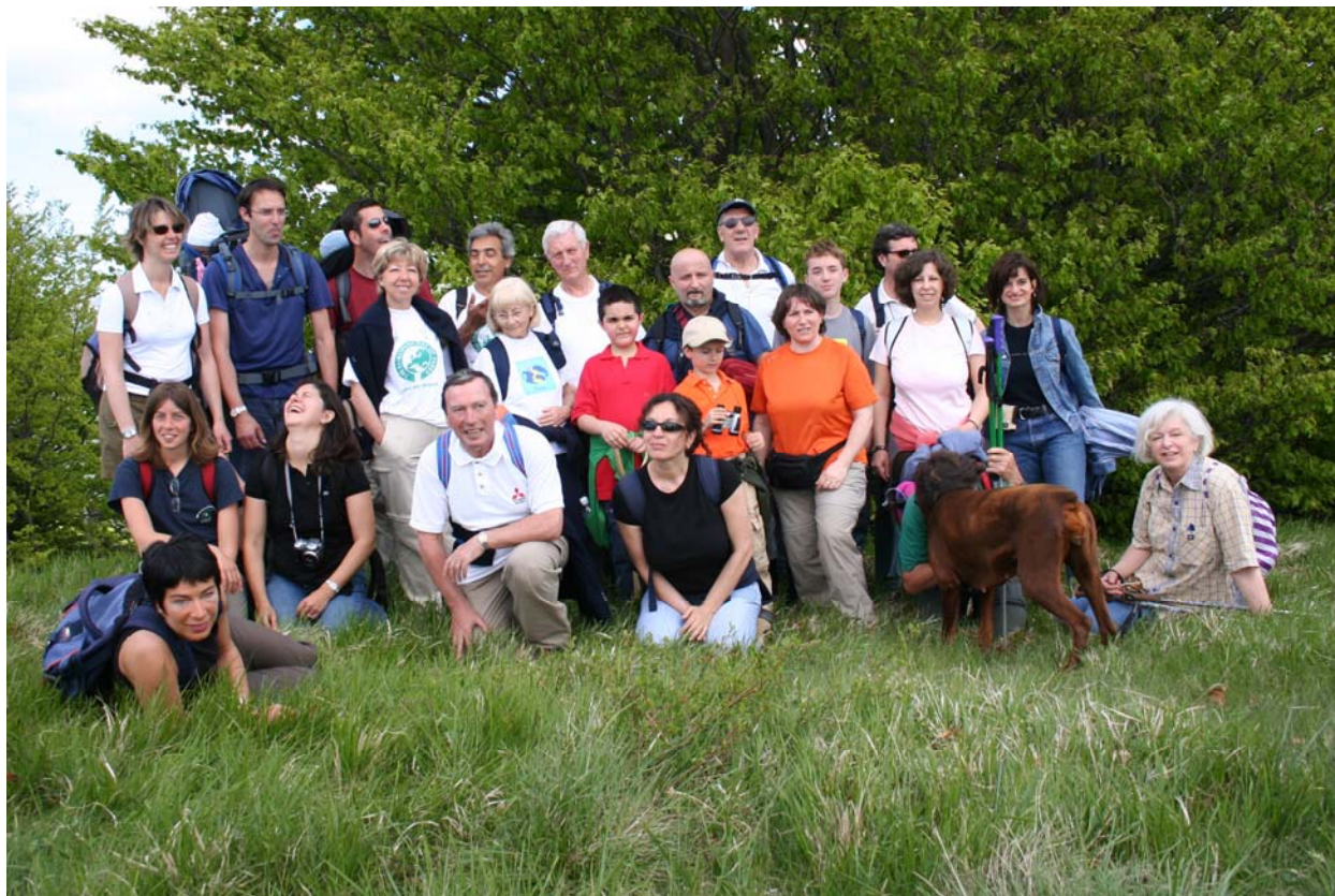
Il monte Cavalla, non lontano da Fascia, il comune più alto della Liguria, 1118 m (14 maggio)