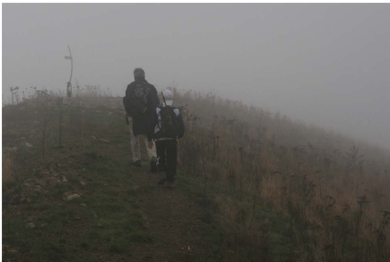
Proprio dietro Genova: nella nebbia, verso la vetta del monte Alpesisa... (19 ottobre)