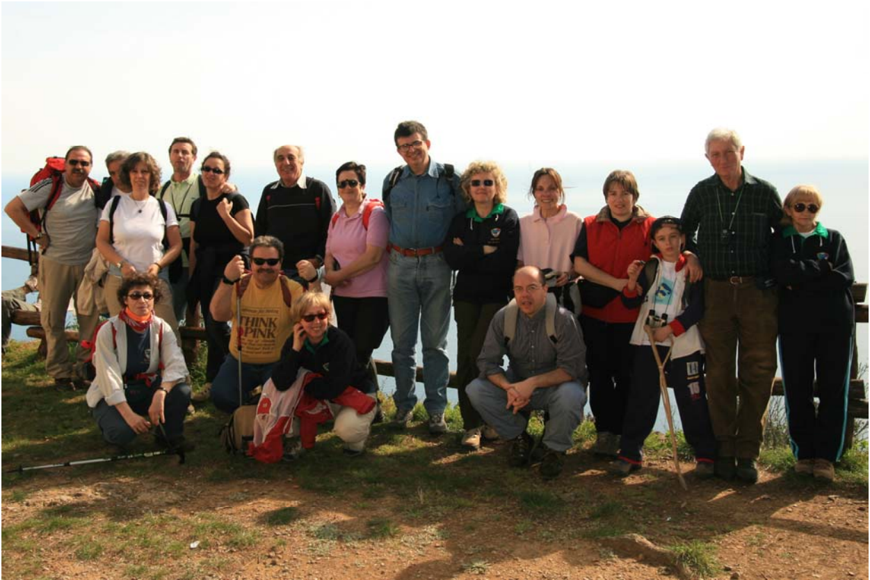
Località "Semaforo Nuovo", sul monte di Portofino (11 marzo)