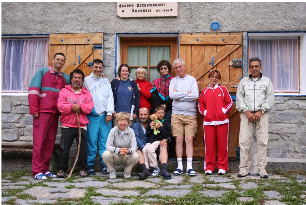
Il rifugio Ciarlo Bossi in Alta Val Tanaro, Carnino inferiore CN (10 luglio)