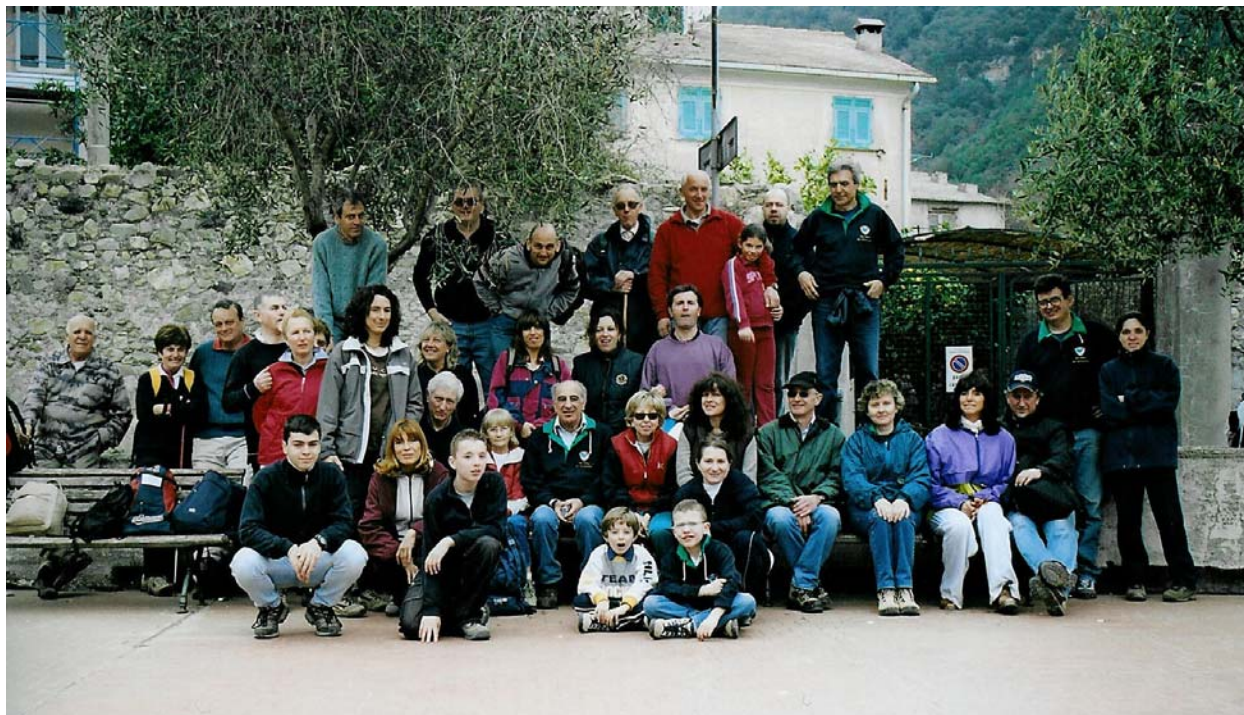
A Deiva Marina (20 marzo)