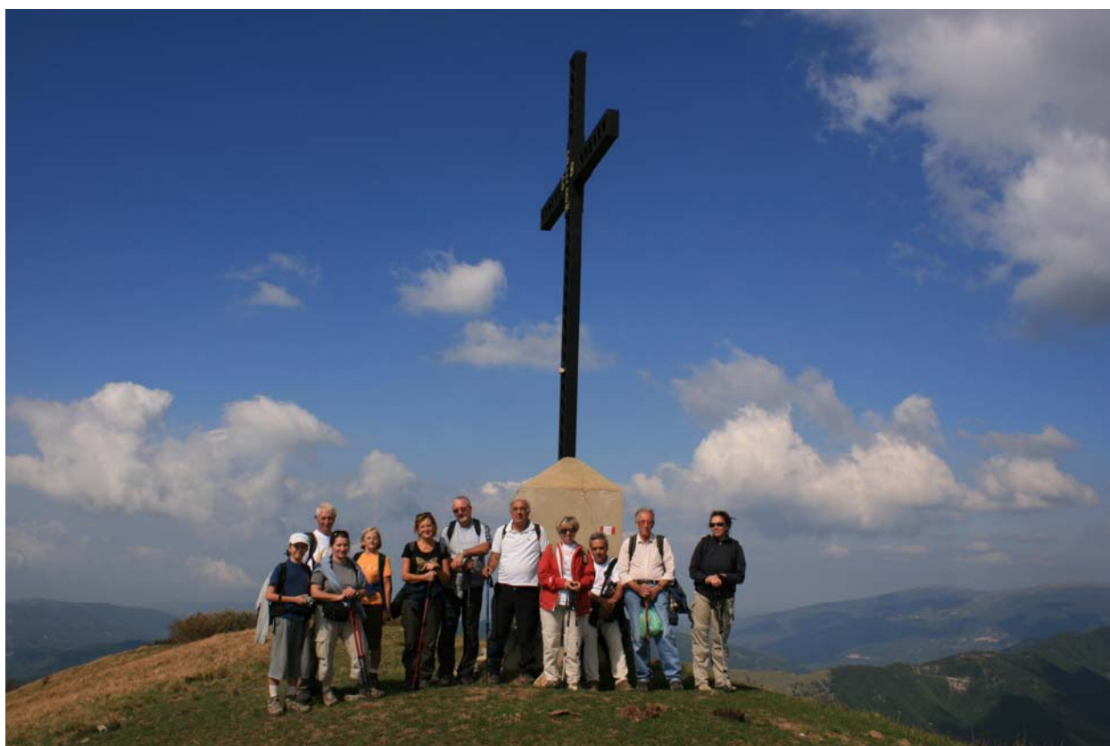
Cima del monte Buio - Parco Antola (27 settembre)