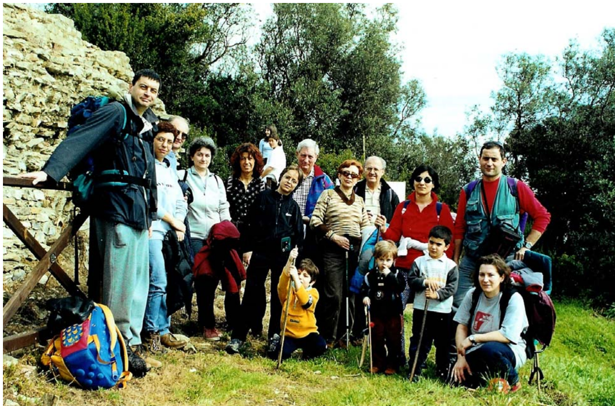
Quattro passi sul mare lungo l'antica via romana Julia Augusta, tra Albenga e Alassio (11 marzo)