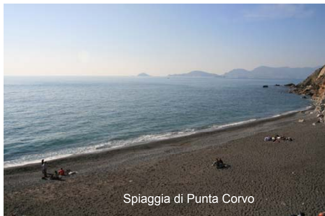
Spiaggia di Punta Corvo

670910 info.montemarcello@libero.it tel. 0187 691071 info@parcomagra.it ). Si segue il sentiero 3d, ignorando la deviazione a destra (n.4), sconsigliata, a causa di una pericolosa frana nella zona di Tellaro. Da una piazzola, si tralascia il sentiero verso Bocca di Magra (è il ritorno) e si perde rapidamente quota, aiutandosi con i bastoncini, lungo circa 700 stretti scalini (attenzione!), che precipitano fino alla bella spiaggia di Punta Corvo, con una vista unica sulle isole del Golfo di La Spezia (30m-45m). La sosta, dato il luogo, non sarà breve e la risalita va affrontata