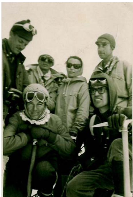
↑ Vetta del Breithorn - Monte Rosa 4165 mt 19.8.64