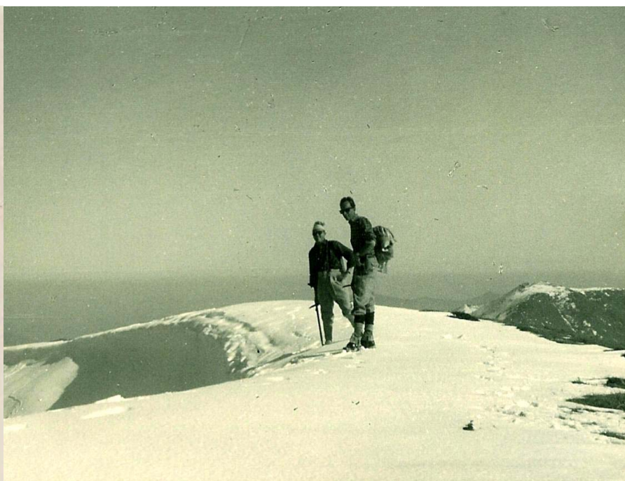
↑ Monte Bue 23.2.64