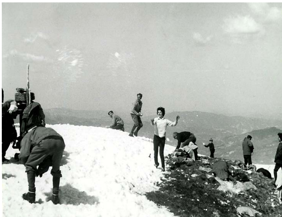
La vetta dell'Antola ↓ anni Sessanta