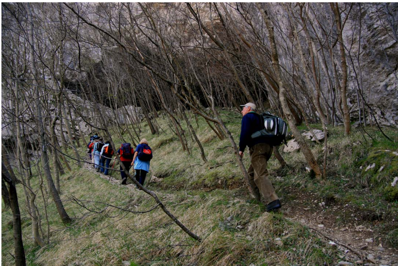
Salendo all'ingresso dell'Arma do Cupa', in Val Ferraia tra Liguria e Piemonte