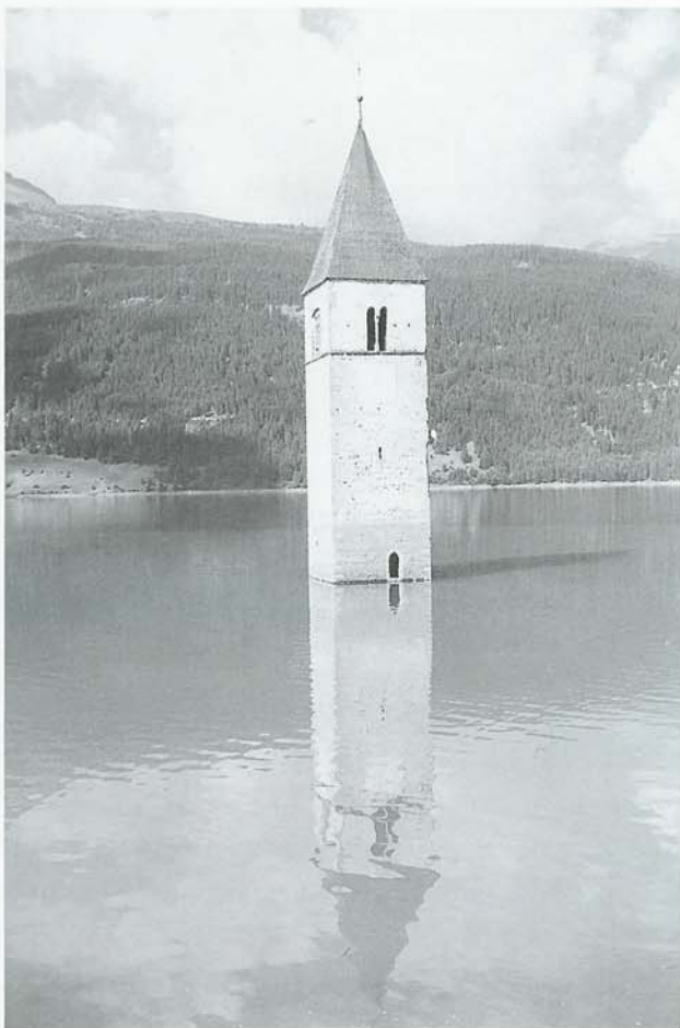
Il campanile di Santa Caterina a Curon Venosta

Tendershof (0473 632011), il ristoro Greinhof (0473 634574), il ristoro Plawenn (0473 835183), il ristoro Giernhof (3478830763), il rifugio Pio XI (0473 633191- 633434), con una cinquantina di posti letto, ecc.