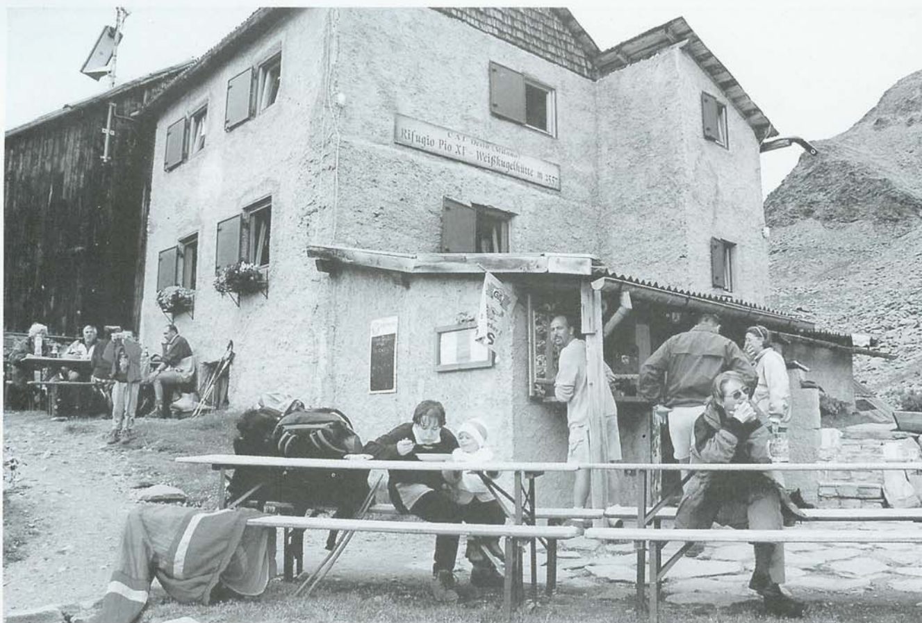
Il rifugio Pio XI