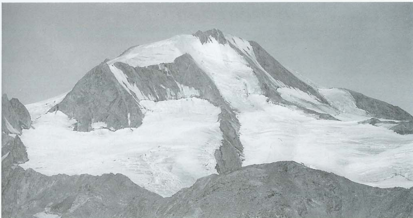
Il maestoso Palla Bianca visto dalla Val Senales

NEI DINTORNI: In Val Venosta ci sono moltissimi castelli, tra cui il “Castel Coira” (tel. 0473 615241), edificato nel 1253 a Sluderno, autentico gioiello architettonico. La fama è dovuta alla presenza di una ricchissima collezione d’armi e una raccolta di corazze costruite dagli artigiani più esperti dell’epoca. Da rammentare, inoltre, Samnaun (informazioni turistiche al numero telefonico 0041 81 8685858), zona franca simile a Livigno, che si trova in Svizzera, pochi chilometri oltre il Passo Resia.