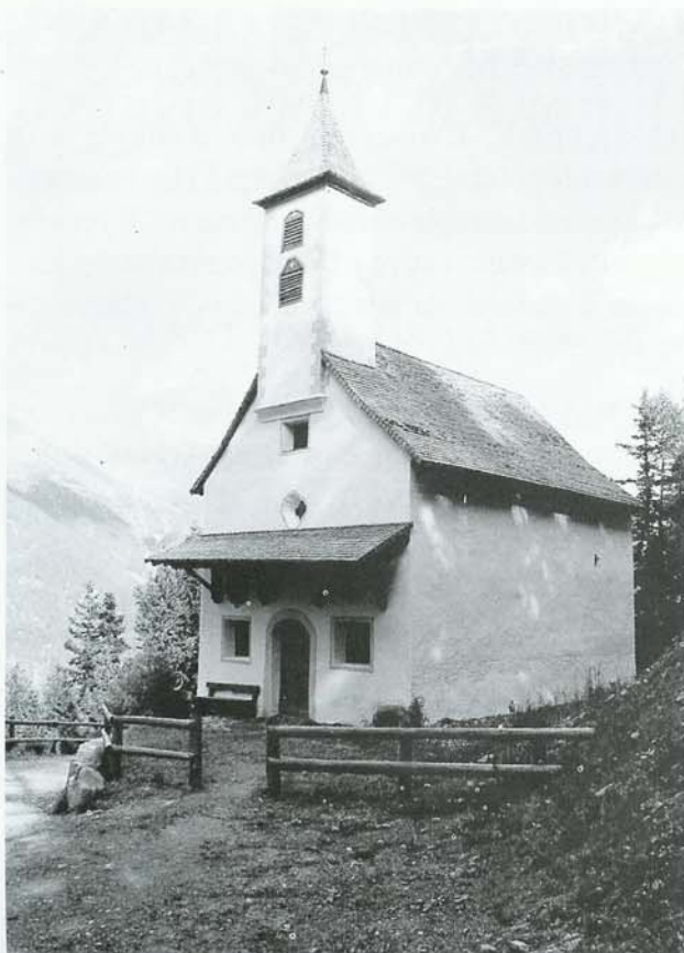
La chiesetta di San Martino (1781 m. s.l.m.) sopra il lago di San Valentino