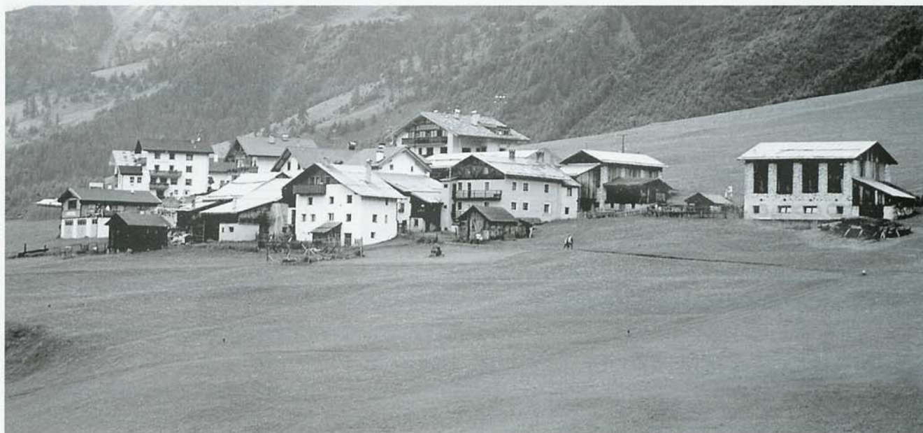
La frazione di Melago

ITINERARIO: Dal piccolo borgo (1912 m s.l.m.) si segue il segnavia n. 2 che perviene, quasi in piano, nei pressi della malga Melago, costeggiando un torrente. In breve, guadato un rio, si incomincia una dura salita, con una serie di tornanti che risalgono ripidamente il versante, povero di vegetazione, della montagna. Si arriva, così, ad una croce e una panchina, dove poter riprendere fiato. Si continua, con un dislivello, ora, meno accentuato, pervenendo, infine, con alcune ultime rampe, al rifugio Pio XI (2h -2h30m), situato a quota 2542,