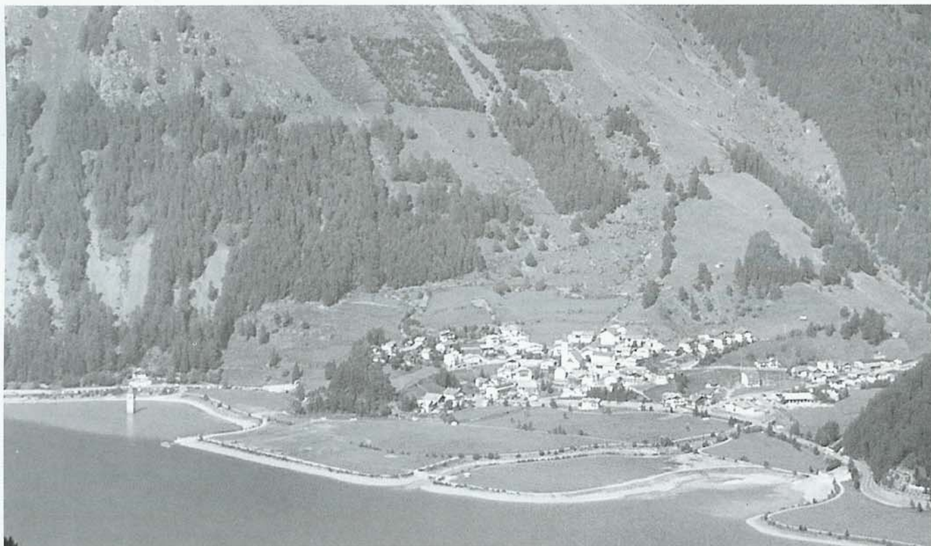
Curon Venosta dal sentiero n. 14

Durante il periodo invernale si pratica lo sci alpino, grazie agli impianti di risalita, e lo sci di fondo. D'estate, invece, una fittissima rete di sentieri ben segnalati (bandierine bianco rosse contraddistinte da numeri e lettere) interseca il comprensorio con difficoltà di tutti i tipi. Le escursioni più interessanti, oltre a quella descritta di seguito nel testo, sono: Il Piz Lat (2808 m s.l.m.), 3